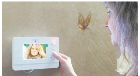
Вот так действует недавно установленный видеодомофон в одной из квартир

– Сколько времени уходит на выполнение работ? – В зависимости от количества желающих. На домофонизацию