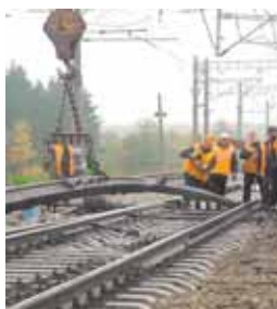
действующего главного пути. Оба объекта должны быть сданы в эксплуатацию в этом году.

Строительство разъезда Московский Комсомолец расширит возможности по пропуску поездов на участке, который сегодня считается лимитирующим из-за большой протяжённости однопутного железнодорожного перегона. Здесь будет установлен новый пост ЭЦ, уложены 8 стрелочных переводов и произведена выправка