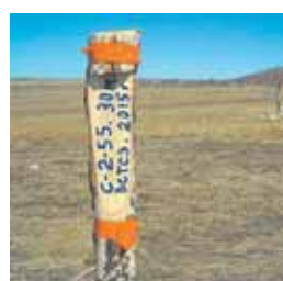
Место строительства Амурского ГПЗ в Свободненском районе

Площадка под строительство выбрана с учетом транспортной логистики (близость р. Зея, федеральной автодороги «Амур», железнодорожной Транссибирской магистрали) и близости крупного населенного пункта (г. Свободный).