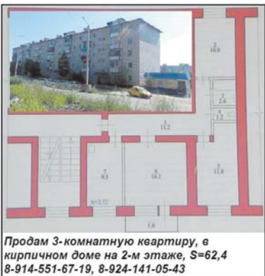
Продам 3-комнатную квартиру, в кирпичном доме на 2-м этаже, S=62,4 8-914-551-67-19, 8-924-141-05-43

■ 2-комнатную СМС в центре. т. 8-914-613-87-14 ■ 2-комнатную по ул. Мохортова. т. 8-914-583-71-12 ■ 2-комнатную СШС, 1 этаж. Окна ПВХ, евробатареи, косметический ремонт, двери заменены. т. 8-914-397-01-26, 4-30-04 ■ 2-комнатную НМС по ул. Депутатской, большую, меблированную, исключительно выгодную – подробности по т. 8-914-392-27-08 ■ 2-комнатную. т. 8-914-563-69-17 ■ 2-комнатную, 3 этаж в 16-этажном доме. т. 8-924-583-05-53 ■ 2-комнатную НМС по ул. Депутатской, тёплую, солнечную, 2500 тыс. руб. Торг. т. 8-914-561-08-51, 4-99-35 ■ 2-комнатную НМС по ул. Депутатской. т. 8-914-573-75-19