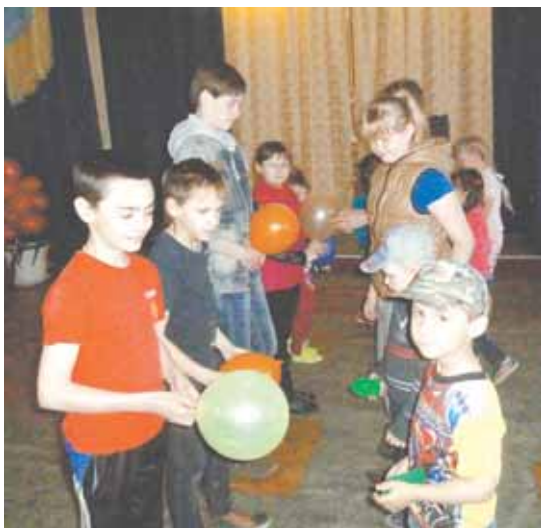
Закладываем фундамент будущего дома