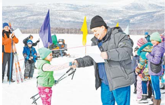
Самая юная участница соревнований