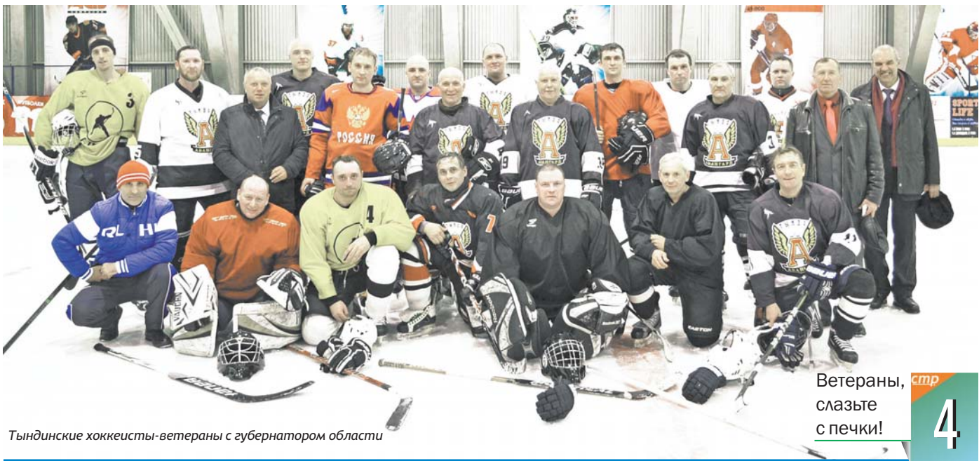
Тындинские хоккеисты-ветераны с губернатором области