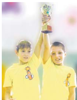
На втором месте — Уркан