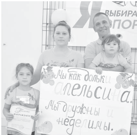
В Первомайском состоялся семейный праздник «Папа, мама, я – спортивная семья».

20 октября на базе Первомайской школы состоялся спортивный семейный праздник «Папа, мама, я – спортивная семья». Поборются за звание самой спортивной семьи могли любые команды, состоявшие из троих человек: двоих взрослых и одного ребёнка.