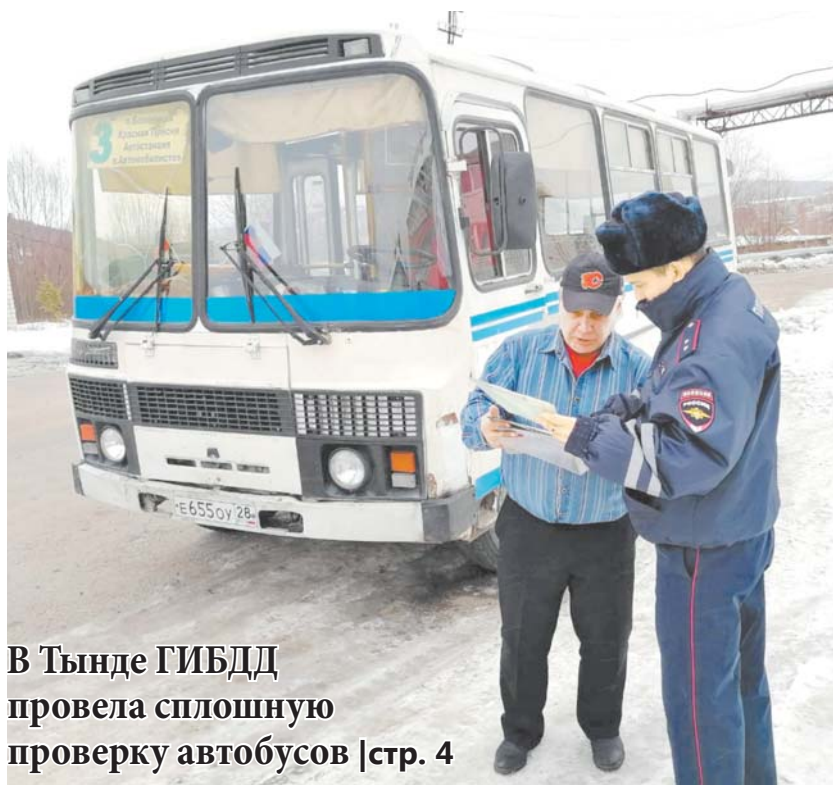
В Тынде ГИБДД провела сплошную проверку автобусов | стр. 4