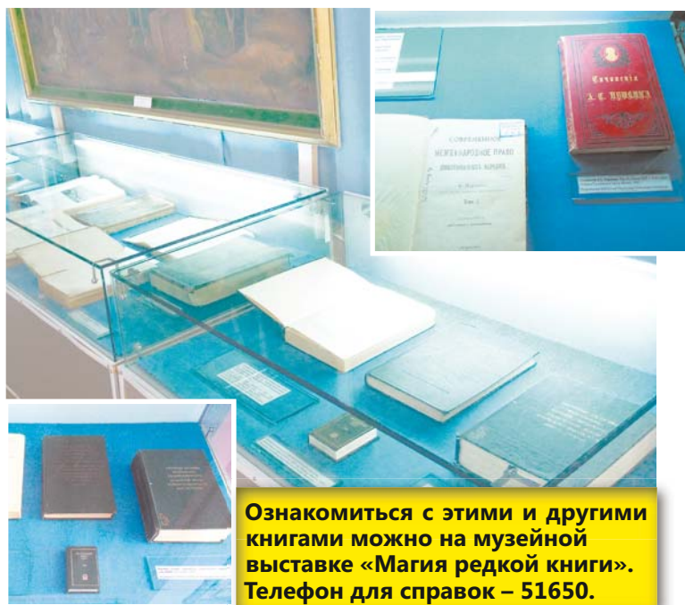
Ознакомиться с этими и другими книгами можно на музейной выставке «Магия редкой книги». Телефон для справок – 51650.

При отнесении той или иной книги к категории редких учитывается культурная значимость печатного издания. Это, прежде всего, книги-памятники – первопечатные экземпляры, прижизненные издания классиков отечественной и мировой культуры и т.д.