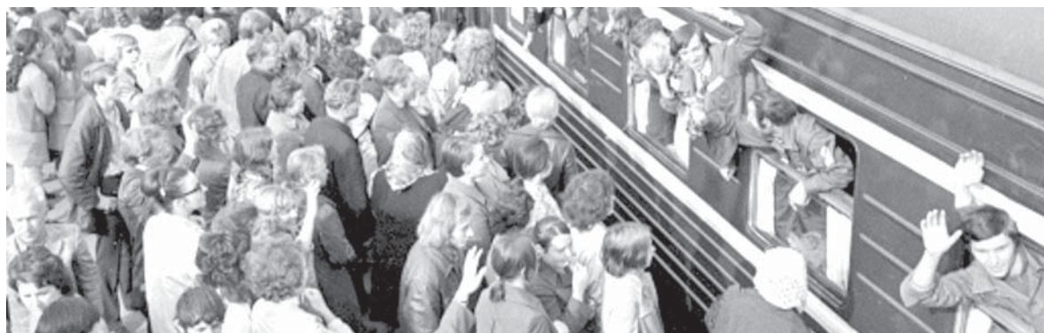
Москва, Ярославский вокзал, 1974 год. Проводы бойцов отряда

1. Предложить НКПС: а) Обеспечить окончание проекта трассы в пределах ст. Ольдой Уссурийской ж.д. и поселков: Тынды, Дамбуки и Стойба на протяжении ориентировочно 750 км – к 1.V.1933 г., а полностью проект всей трассы (ориентировочно протяжением 2.000 км – к 1.XII.1933 г.). б) Направление трассы утвердить с прохождением, после примыкания у ст.