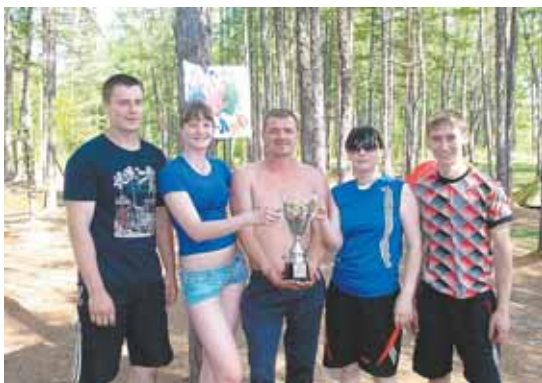
Участники соревнований по пешеходному туризму

День России – праздник свободы, гражданского мира и доброго согласия всех людей. В этот день проходят спортивные мероприятия, концерты, праздничные представления.