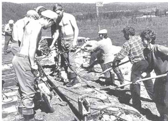
Студенческий строительный отряд Московского института инженеров железнодорожного транспорта на строительстве железнодорожной линии БАМ-Тында (разъезд Пурикан)