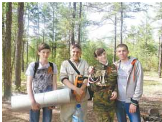
Участники военно-спортивной игры «Зарница»