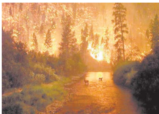
В СЛУЧАЕ ВОЗНИКНОВЕНИЯ ПОЖАРА ЗВОНИТЕ: «101» — единый телефон пожарных и спасателей для набора со всех стационарных и мобильных телефонов

П риближается лето – пожароопасный сезон. Каждый год он приносит новые беды. Горят леса, гибнут животные, нередки человеческие жертвы. Как можно этого избежать?