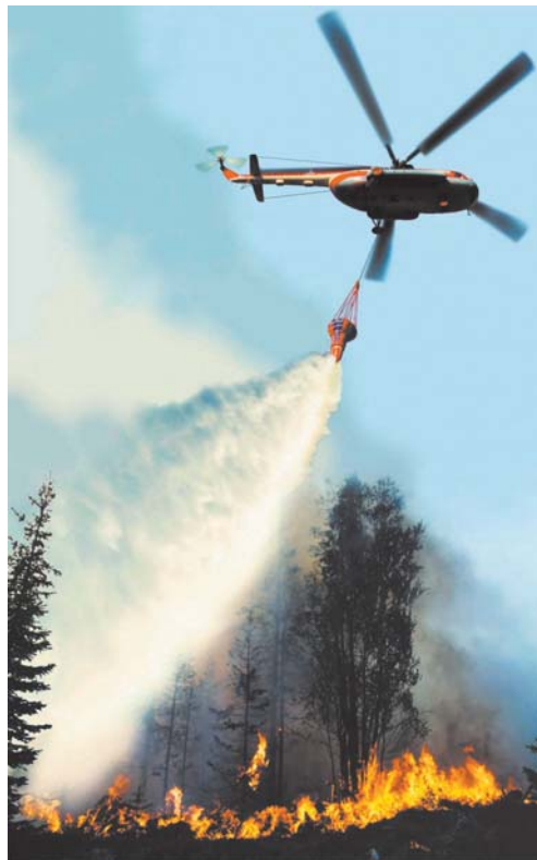
ООО ГДК «Одоло

Вот, что может произойти от одной искры!