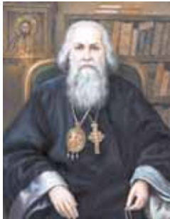
Память святителя Игнатия Брянчаннинова.