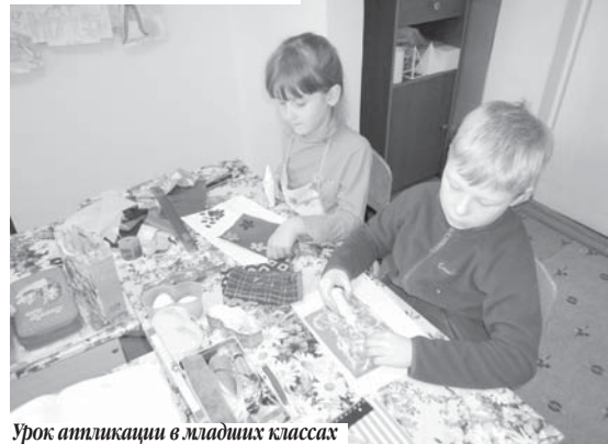
Урок аппликации в младших классах

Труд преподавателей отмечен грамотами и благодарностями администрации Тындинского района, центра развития культуры, молодежной политики и спорта Тындинского района, министерства культуры и архивного дела Амурской области, администрации п. Дипкуна.