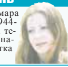
Родилась Тамара Дегтярёва (1944-2018), актриса театра и кино, народная артистка России.