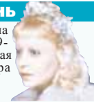
Родилась Янина Жеймо (1909-1989), советская актриса театра и кино.