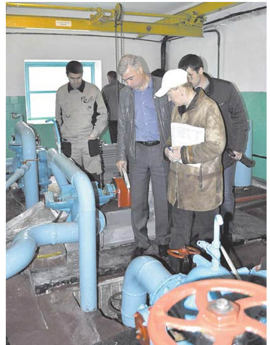
Водозабор Нижний Шахтаум

на территориях, то там все плановые работы идут поставленным целевым заданием. Ведь участки водоснабжения и водоотведения у нас на обслуживании с самого запуска в работу, с начала 80-х годов, поэтому там ремонты все в рабочем режиме. Есть вопросы, касающиеся качества воды в отдельных посёлках, таких как п. Хорогочи и п. Восточный, там уровень железа превышает норматив. Я понимаю, что если мы предоставляем услугу и берём за неё деньги, мы должны делать это качественно. И это сегодня знают потребители, потому что они черпают информацию из разных источников и знают свои права. Другое дело, что в своё время, когда строились в посёлках коммунальные объекты, уже тогда проектные организации, зная по пробным откочкам, что вода не совсем соответствует нормативам, не предусмотрели в технологической схеме водоснабжения станции очистки для питьевой воды. Сейчас, чтобы решить данную проблему, нужно уста-