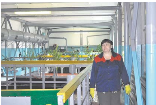
Станция биологической очистки, п. Муртыгит

ков и частного жилого сектора, особенно в летний период, когда у людей начинаются поливы огородов. Как мы с этим боремся?