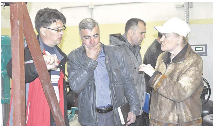
Весенний обезд, г. Тынды