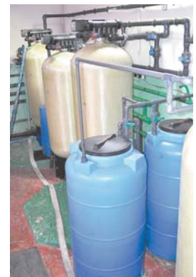
Станция обезжелезивания, п. Хорогочи

на территориях, то там все плановые работы идут поставленным целевым заданием. Ведь участки водоснабжения и водоотведения у нас на обслуживании с самого запуска в работу, с начала 80-х годов, поэтому там ремонты все в рабочем режиме. Есть вопросы, касающиеся качества воды в отдельных посёлках, таких как п. Хорогочи и п. Восточный, там уровень железа превышает норматив. Я понимаю, что если мы предоставляем услугу и берём за неё деньги, мы должны делать это качественно. И это сегодня знают потребители, потому что они черпают информацию из разных источников и знают свои права. Другое дело, что в своё время, когда строились в посёлках коммунальные объекты, уже тогда проектные организации, зная по пробным откочкам, что вода не совсем соответствует нормативам, не предусмотрели в технологической схеме водоснабжения станции очистки для питьевой воды. Сейчас, чтобы решить данную проблему, нужно уста-