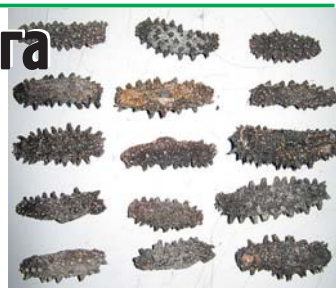
Задержанный трепанг (морской огурец)

Вывоз трепанга допускается только при наличии разрешительных документов и регулируется Конвенцией о междуна-