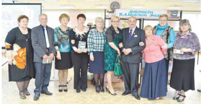
Снимок на память в библиотеке