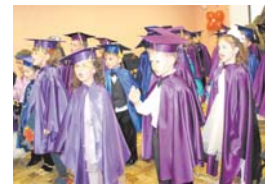
Академия интеллектуального и эстетического развития