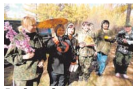
Блюда представляем, в Японию приглашаем!