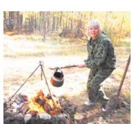
Разжигаем мы костёр, чай таёжный уж готов!