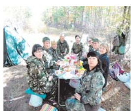
Вся команда за столом настесным, маленьким кружком!