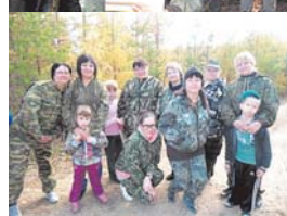
Получаем мы награды. Всем спасибо, очень рады!

ОБЩЕСТВЕННО-ПОЛИТИЧЕСКИЙ ЕЖЕНЕДЕЛЬНИК «БАМ» Адрес редакции и издателя: 676282 г. Тында, ул. Красная Пресня, 47 (здание администрации Тындинского района), каб. 316. телефон: 8 (4162) 55-666 факс: 8 (4162) 47-666 e-mail: bam98@list.ru сайт: www.gazeta-bam.ru