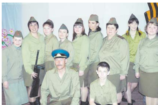
Спектакль «У войны не женское лицо»

Валентина Орлянская, пресс-служба администрации Тындинского района