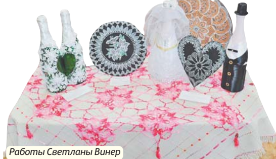
Работы Светланы Винер