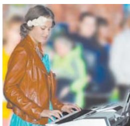
На юбилее посёлка