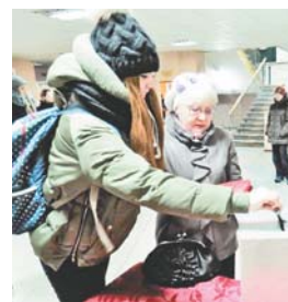
Сбор средств в городском Дворце культуры