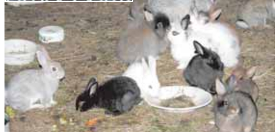
Снимки сделаны в августе 2014 г.