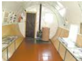
Бочка Диогена в Музее истории БАМа