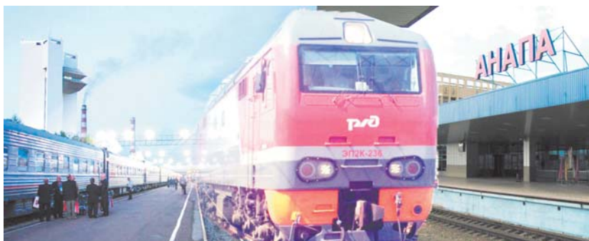
Поезд Тында – Анапа даёт возможность пассажирам без пересадок доехать к морю

Желающих провести более 6 суток в пути до популярного черноморского курорта достаточно. В железнодорожных кассах выстраиваются длинные очереди, жители северных станций приобретают билеты заранее. Стоимость