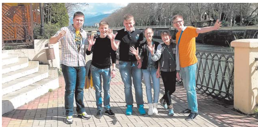
Лауреаты III городского фестиваля «Молодость+» участвовали в XXII Международном фестивале «Хрустальная магнолия» в городе Сочи Подробности в следующем номере