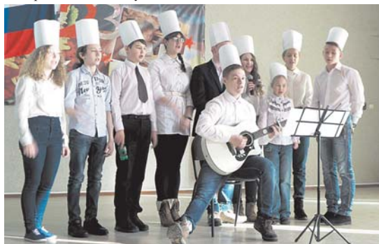
Звучит песня «Я люблю китайскую кухню»

«Диалекта». Гости смогли увидеть кукольный театр, рассказывающий о китайском зодиаке, узнать побольше о традициях празднования китайского Нового года, о китайском чае, увидеть чайную церемонию и попробовать настоящий китайский чай. Как обычно, не обошлось без песен и традиционных танцев, стихов и песен на китайском языке. Даже дедушка Мороз не смог пропустить хоть и китайский, но всё же Новый год и пришёл поздравить всех гостей и участников.