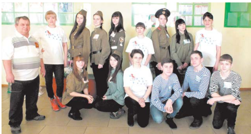
Фото участников игры