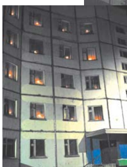
Небольшая часть дома №2

конечно же, волонтерской организации «Я горжусь!» под руководством Н.А. Тимошиной,