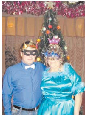
Король и королева бала