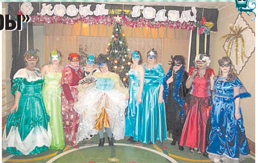
Вечеринка в стиле XIX века