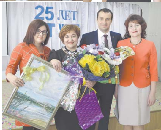
Руководство БАМИЖТ с уверенностью смотрит в будущее

Материалы полосы подготовила Вера Григорьева