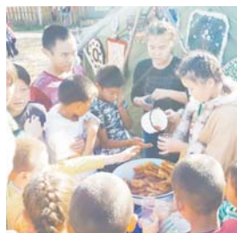
Угощение во время акции

В течение всего мероприятия на площадке царил веселая атмосфера, наполненная азартом участников и болельщиков. Они получили заряд положительных эмоций и почувствовали дух соревнований. После подвели ито-