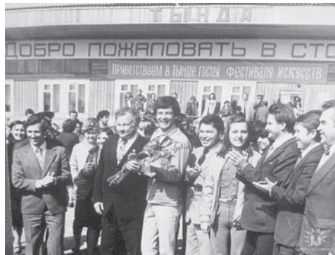
Тында 1979 г.