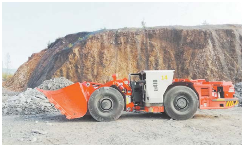
Новая погрузочно-доставочная машина работает под землёй

ООО «Березитовый рудник» разрабатывает одноименное золотополиметаллическое месторождение, расположенное в Тындинском районе Амурской области в 130 километрах от ж/д станции Сковородино. Освоение Березитового месторождения ведётся с 2007 года. Объём производства аффинированного золота «Березитовым рудником» в 2017 году составил 94,3 тыс. унций (2 т 933 кг), что на 18% (или 453 кг) больше объёмов 2016 года.