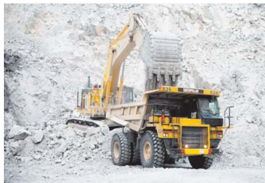
В работе новые экскаватор Komatsu и 55-тонный автосамосвал Caterpillar

«Ежегодные инвестиции в поддержание и развитие производства, в том числе в обновление парка горной техники – это залог стабильной, надежной и успешной работы рудника. Высокая интенсивность эксплуатации транспортных средств в тяжелых горных условиях приводит к их скорейшему износу. Поэтому «Березитовый рудник» направляет значительную часть инвестиций на пополнение автотранспортного комплекса новой техникой, за счет чего удаётся поддерживать производительную эффективность и создавать безопасные условия труда для сотрудников рудника, занятых работой на транспорте».