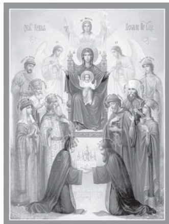
скромные, поступь тихая, голос ровный; так что вид Её был отражением души, олицетворением чистоты.

Она была Девой не только телом, но и душой: смиренна сердцем, осмотрительна в словах, благоразумна, немногоречива, любительница чтения... трудолюбива, целомудренна в речи, почитава человека, но Бога судьей Своих мыслей. Правилom Её было – никого не оскорблять, всем благожелать, почитать старших, не завидовать равным, избегать хвастовства, быть здравомысленной, любить добродетель. Разве Она хотя бы выражением лица когда-нибудь обидела родителей или была в несогласии с родными, погордилась перед человеком скромным, посмеялась над слабым, уклонилась от неумирующего? У Неё не было ничего сурового во взгляде, ничего неосмотрительного в словах, ничего неприличного в действиях: телодвижения