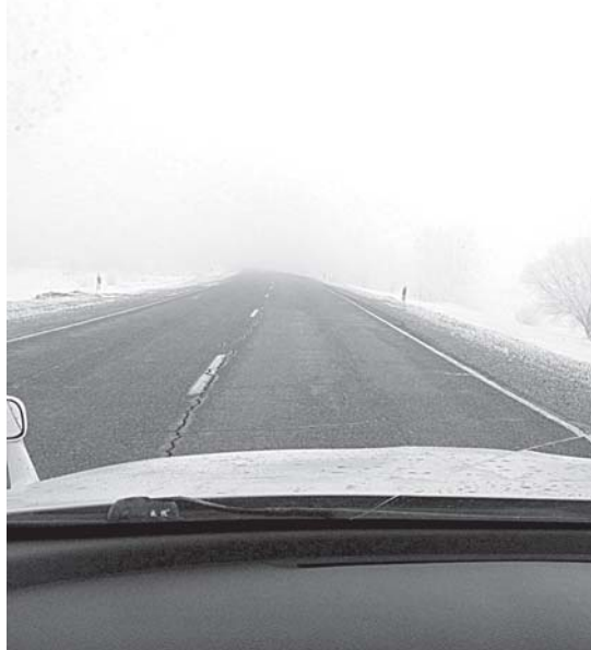
Федеральная автодорога М58 «Амур» Чита-Хабаровск, 16 марта, утро, туман