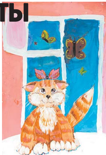
Лидия Бакшеева, «Весёлые бабочки»