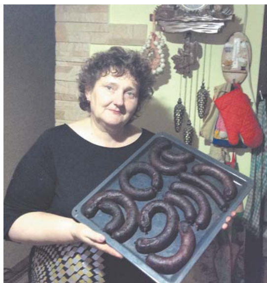
Такой продукцией собственного изготовления не грех и похвалиться