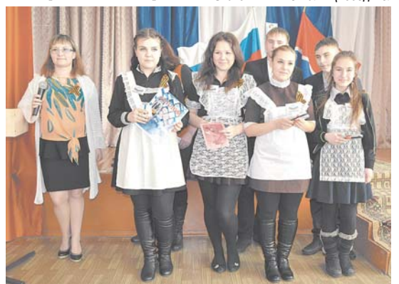
«Выбор» п. Юктали

о вкладе экспедиции учёного и натуралиста Ричарда Маака в исследование флоры и фауны Приамурья. Именно ему в этом году посвящён День молодого избирателя в Амурской области. Второй год подряд в нашем регионе избирательные кампании проходят по теме «Выбор, достойный памяти основателей Приамурья!». В прошлом году такой исторической личностью стал генерал-губернатор Восточной Сибири Николай Муравьёв-Амурский.