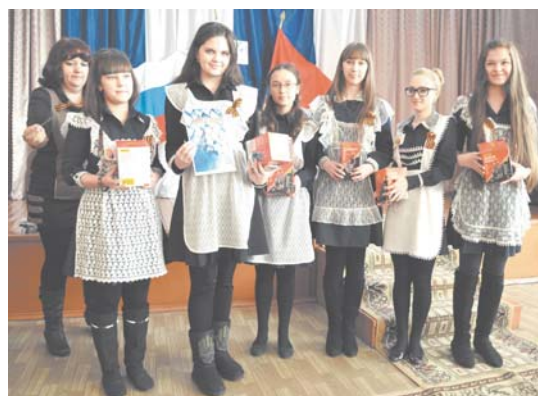
«Знатоки» п. Юктали (победители)