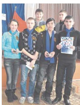
«Патриоты» с. Усть-Нюкжа

Во время игры «Маршрут избирателя» участники и зрители посмотрели небольшой фильм