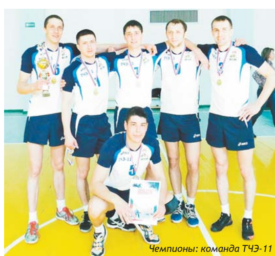
Чемпионы: команда ТЧЭ-11

В соревнованиях приняли участие 6 команд. В течение двух дней на площадке кипели страсти. В итоге победителем стала команда ТЧЭ-11. Второе место заняли спортсмены из команды ПМС-310, замкнула тройку призеров команда АО «Коммунальные системы БАМа». Хочется поблагодарить