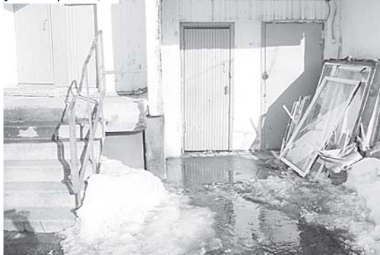
ул. Мохортова, 3