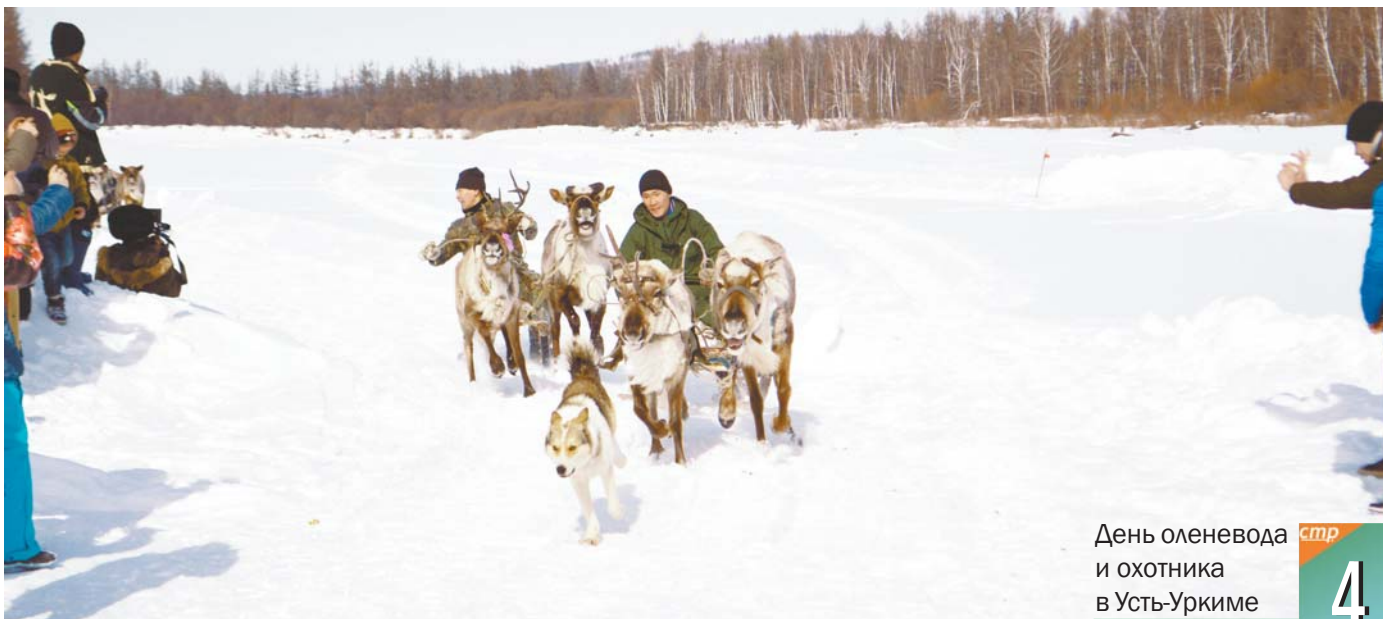
День оленевода и охотника в Усть-Урхиме