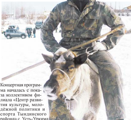
Концертная программа началась с показа коллективом филиала «Центр развития культуры, молодёжной политики и спорта Тындинского района» с. Усть-Уркиме

Приглашаем жителей района на следующий год к нам на праздник День оленевода и охотника!